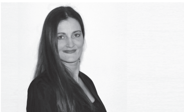
KATHRIN SACHSE PhotoArtwork.

Flyer zum Mitnehmen in der weißen Kiste.